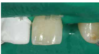
Isolierte Arbeitsfläche in Ansicht von labial.