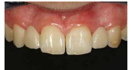
En-face-Ansicht der Versorgung mit adhäsiven, einflügeligen Klebebrücken zum Ersatz der beiden seitlichen Schneidezähne.