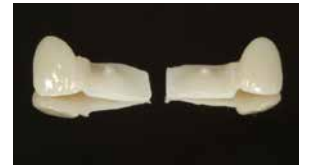
Einflügelige Klebebrücken zum Ersatz der Zähne 12 und 22. Die Klebeflügel werden jeweils an den mittleren Schneidezähnen befestigt.