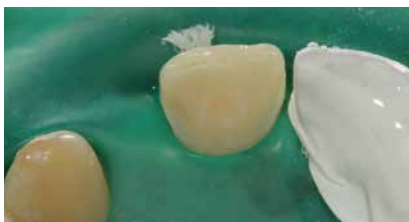
Gruppenkofferdammisolation der Klebeflächen. Ansicht von inzisal. Zahn 11 ist mit einem Stück Teflonband geschützt.