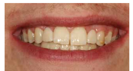
Der jugendliche Patient freut sich über seine neuen Zähne.