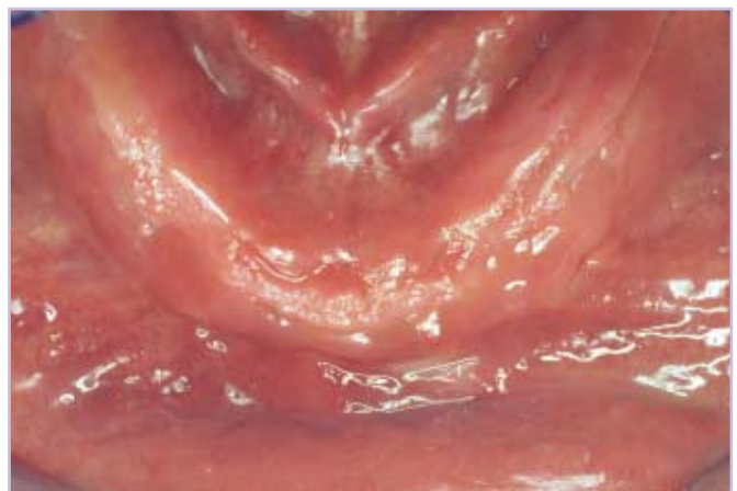
Abb. 8: Nach 3 Wochen ist eine vollständige Ausheilung festzustellen. Die weichbleibend unterfütterte Prothese wird vom Patienten problemlos getragen.