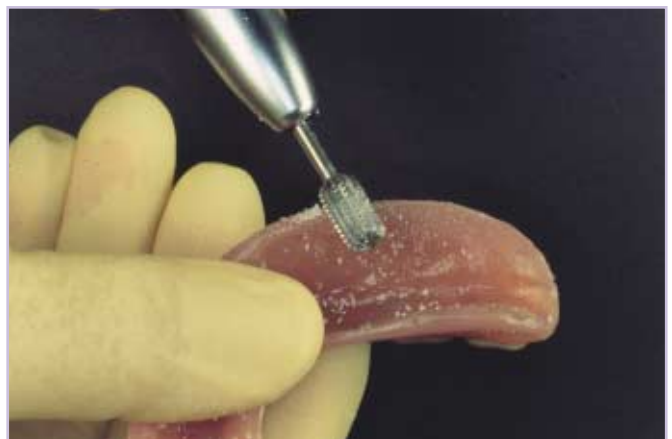
Abb. 4: Nach der Entnahme aus dem Mund und der Desinfektion erfolgt die formgebende Bearbeitung des weichbleibenden Unterfütterungsmaterials mit kreuzverzahnten Stahlfräsen.

Zur Sicherstellung eines guten Verbundes zwischen Prothesenbasismaterial und Unterfütterungsmaterial ist nach einer Aufrauung der Prothesenbasisfläche und dem Einschleifen der rechtwinkligen Kante der Auftrag eines Haftvermittlers erforderlich (Mucopren Adhäsiv, Kettenbach GmbH & Co. KG, Eschenburg). Anschließend wird das Material auf die gesamte Basisfläche des hohlgeschliffenen Zahnersatzes aufgetragen. Nach dem Einbringen des Zahnersatzes in den Mund wird der Patient aufgefordert, möglichst fest zuzubeißen und – sofern erforderlich – entsprechende Funktionsbewegungen durchzuführen. Schon nach einer Verweilzeit von 3 Minuten und 15 Sekunden im Mund des Patienten kann der Zahnersatz entnommen werden. Die gesamte Unterfütterung dauert nur 5 Minuten 30 Sekunden. Anschließend wird die Unterfütterung für 15 Minuten im Wasserbad (45 – 50 °C) gelagert, um einen optimalen Haftverbund zu erreichen, dann können die Überschüsse entfernt werden.