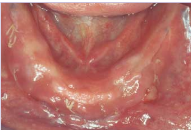
Abb. 7: Zustand 12 Tage post operationem mit weitgehend ausgeheilten gingivalen Verhältnissen.