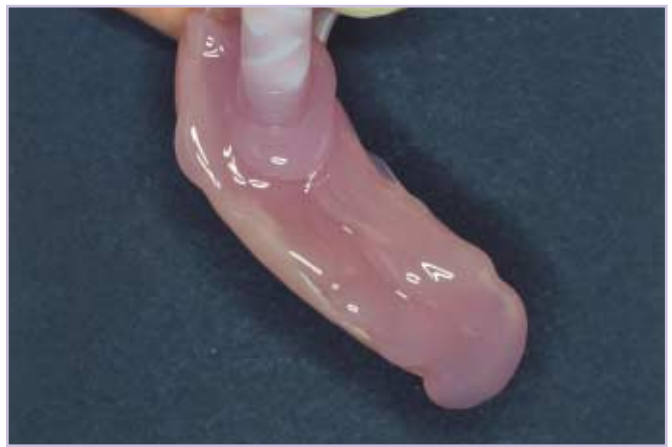
Abb. 3: Die Applikation des Unterfütterungsmaterials erfolgt direkt auf die mit Adhäsiv beschichtete Prothese.

Die Applikation des Materials kann ohne das Risiko von Anmischfehlern und nahezu blasenfrei direkt aus dem Kartuschensystem erfolgen, so kann das Material sparsam ohne Anmischverluste verarbeitet werden. Das Material zeichnet sich durch eine hervorragende Stabilität im Mundmilieu und eine homogene glatte Oberfläche aus. So können saubere hygienische Verhältnisse hergestellt werden. Es behält seine elastischen Eigenschaften auch bei längeren Anwendungszeiten und es treten keine Verfärbungen