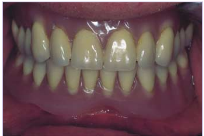
Abb. 6: Frontalansicht des eingegliederten unterfütterten Zahnersatzes beim ersten Kontrolltermin 12 Tage post operationem.