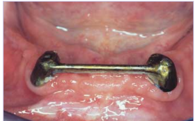
Abb.1: Insuffiziente Stegkonstruktion auf den Zähnen. Aufgrund massiver Sekundärkaries ist es zu einer Lockerung des Steges gekommen.

Nachfolgend soll am Beispiel einer implantatprothetischen Versorgung der Einsatz eines Unterfütterungsmaterials auf Polyvinylsiloxan-Basis dargestellt werden. Der 61jährige Patient stellte sich aufgrund eines insuffizienten Prothesenhaltes mit dem