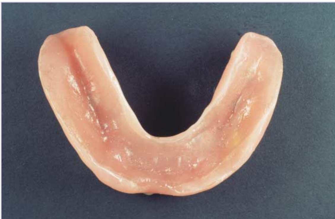
Abb. 9: Auch nach einer Tragezeit von 12 Wochen sind am unterfütterten Zahnersatz keine Anzeichen von Verfärbungen oder Ablösungen des Unterfütterungsmaterials zu beobachten.