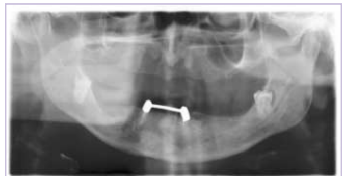
Abb. 2: Röntgenbefund bei Behandlungsbeginn. Nach Entfernung der Weisheitszähne ist die Insertion von jeweils 4 Implantaten im Ober- und Unterkiefer für die Versorgung mit einem teleskopverankerten Zahnersatz geplant.

Wunsch nach einer prothetischen Neuversorgung vor. Im Unterkiefer war der Patient mit einer stegretinierten Prothese versorgt, die Konstruktion hatte sich aufgrund massiver Sekundärkaries gelockert. Aufgrund der umfangreichen kariösen Zerstörung war keine ausreichende Pfeilerwertigkeit für eine