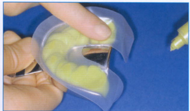
Abb. 2: Plicafol -Trennfolie wird aufgelegt und andrückt. Der Löffel mit Putty und Folie wird in den Mund gegeben und fest aufgespreßt.