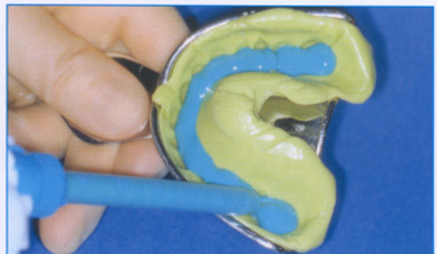
Abb. 4: Das Abformmaterial wird in einer durchgehenden gleichmäßigen Schicht von zwei bis drei Millimeter Dicke in den gesamten Löffel gegeben.

reicht. Die Folie dehnt sich und umfließt die Zähne. Sie kann nach der Entnahme leicht und rückstandslos von dem ausgehärteten Putty abgezogen werden. Das Resultat ist ein stark vergrößerter Abdruck, in Aussehen und Funktion vergleichbar mit einem individuellen Löffel, ohne die bei anderen Folien übliche Faltenbildung und ohne Überhänge (Abb. 3). Diese Vorabformung kann sofort ohne weitere Bearbeitung entweder als Erstabdruck für die Korrekturabformung oder im Verfahren einer Einphasenabformung als individueller Abformlöffel weiterverwendet werden.