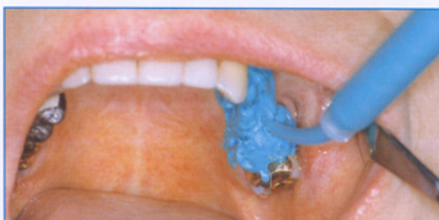
Abb. 5: Die Details der Präparation und die Sulkusregion werden im Mund umspritzt.

Die nun folgenden Arbeitsschritte stellen die eigentliche Abformung dar. Zunächst wird das Korrekturmaterial Panasil contact two in one in einer Dicke von 2 bis 3 Millimetern in den gesamten Löffel gegeben (Abb. 4). Danach oder gleichzeitig wird die Präparation in der üblichen Weise im Mund umspritzt (Abb. 5). Der Löffel wird nun eingebracht, mit mäßigem Druck aufgespreßt, bis zum vollständigen Aushärten gehalten und axial abgezogen. Die fertige Abformung zeigt die für die Folienabformung typische Verteilung der Materialphasen mit einer für die Anwender der klassischen Korrekturabformung ungewohnt starken Schichtstärke des Korrekturmaterials und ohne die für den Doppelmischabdruck typi-