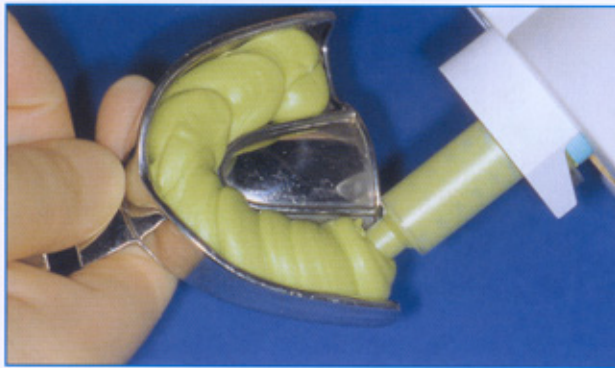
Abb. 1: Ein konfektionierter Abformlöffel wird zu zwei Dritteln mit Panasil binetics putty fast befüllt.